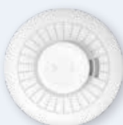
Détecteur de chaleur