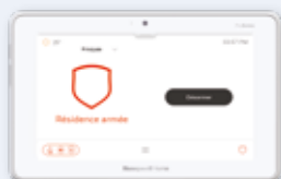
Écran tactile de 17,78 cm (7 po) (sans fil)