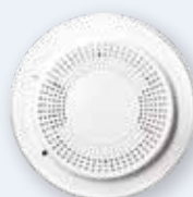
Détecteur de fumée