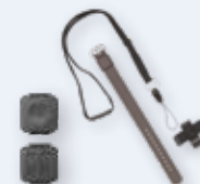
Boutons d'alerte et d'urgence médicale