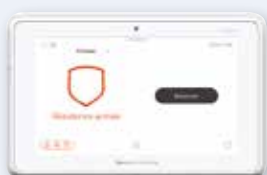
Écran de 17,78 cm (7 po) tout-en-un