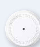
Détecteur de bris de verre