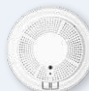
Détecteur combiné de fumée et de monoxyde de carbone